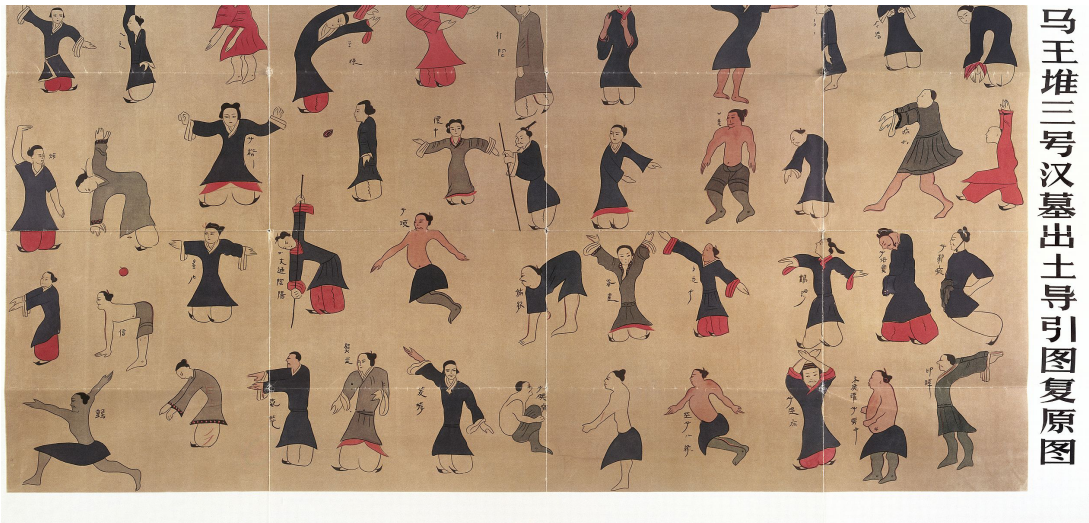
马王堆三号汉墓出土导引图复原图

Las ilustraciones en este documento se basaron en la Reconstrucción del ' Gráfico de guía y tracción ' excavado en la Tumba 3 de Mawangdui (sellada en 168 a. C.) en el antiguo reino de Changsha. El original se encuentra en el Museo Provincial de Hunan, China.